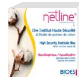
A l'huile de graine de coton

Pot de 250 ml Prix public indicatif : 10,50 € Code ACL : 4791949