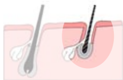
Le poil est arraché depuis le fond du follicule