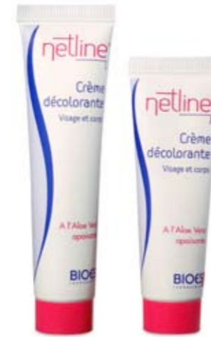
A l'aloë vera apaisante