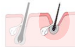
Le follicule s'élargit et facilite la sortie du poil

Grâce à la chaleur, le follicule se dilate et s'ouvre, la sortie du poil s'en trouve donc facilitée et moins douloureuse.