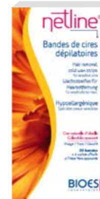
Cire naturelle d'abeille