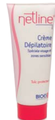
Au talc protecteur

Tube 20 + 40 ml Prix public indicatif : 9 € Code ACL : 6528191