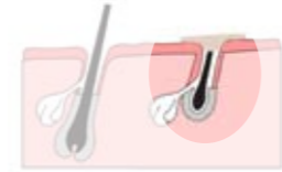
La crème dissout le poil en surface et à la sortie du follicule

Les acides thioglycoliques contenus visent à dissoudre le poil à la surface et à la sortie du follicule. C'est une méthode simple et sans douleur, mais qui peut être mal tolérée par certaines peaux sensibles. La repousse du poil est rapide.