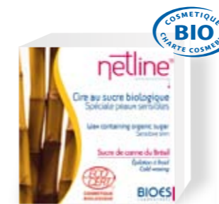
Au sucre de canne

Visage 20 bandelettes Prix public indicatif : 6 € Code ACL : 4814202