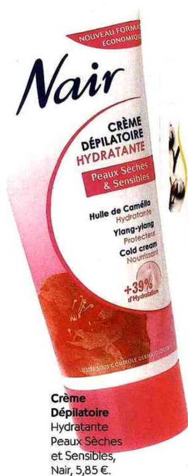
Crème Dépilatoire Hydratante Peaux Sèches et Sensibles, Nair, 5,85 €.

Les plus adaptées • Crème Dépilatoire Haute Tolérance, Laurence Dumont, 7,50 € • Crème Dépilatoire Hydratante Peaux Sèches & Sensibles, Nair, 5,85 €.