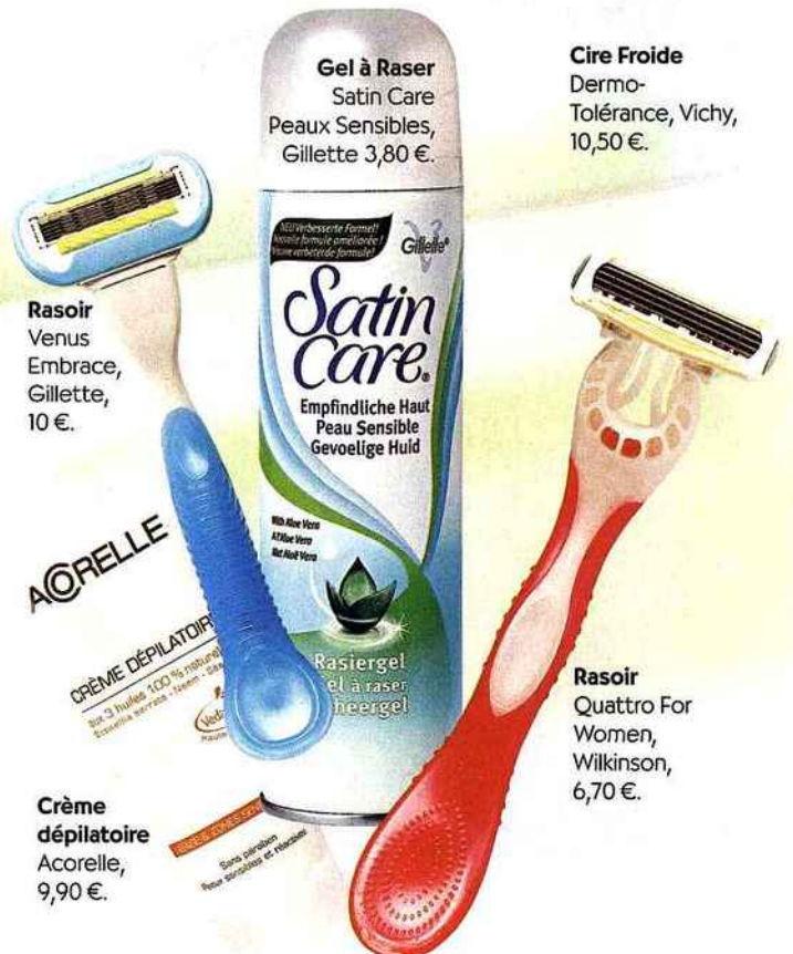
Gel à Raser Satin Care Peaux Sensibles, Gillette 3,80 €.