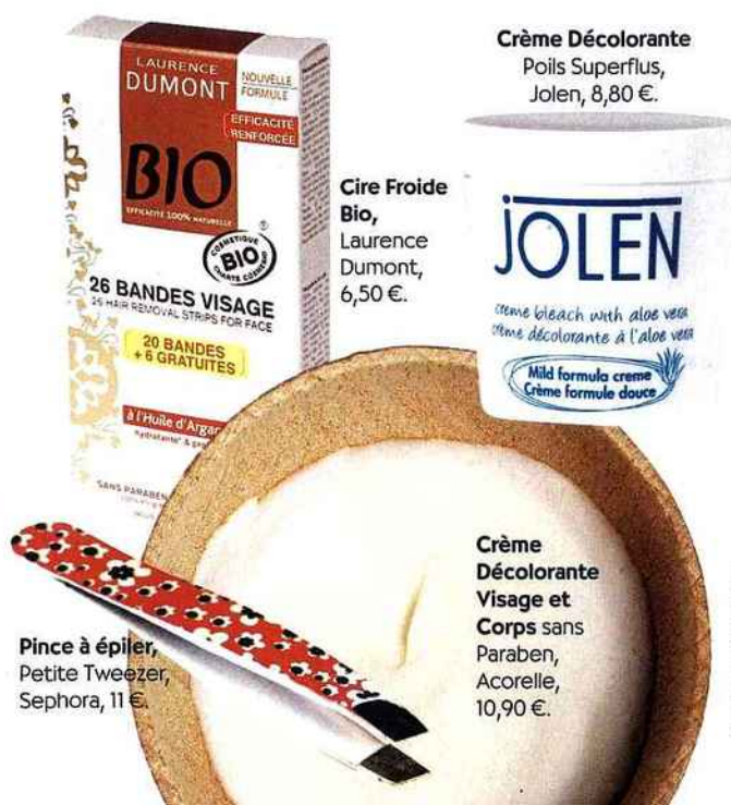
Crème Décolorante Poils Superflus, Jolen, 8,80 €.